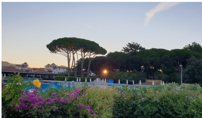
Sonnenaufgang auf der Hotelanlage, letzter Ferienmorgen